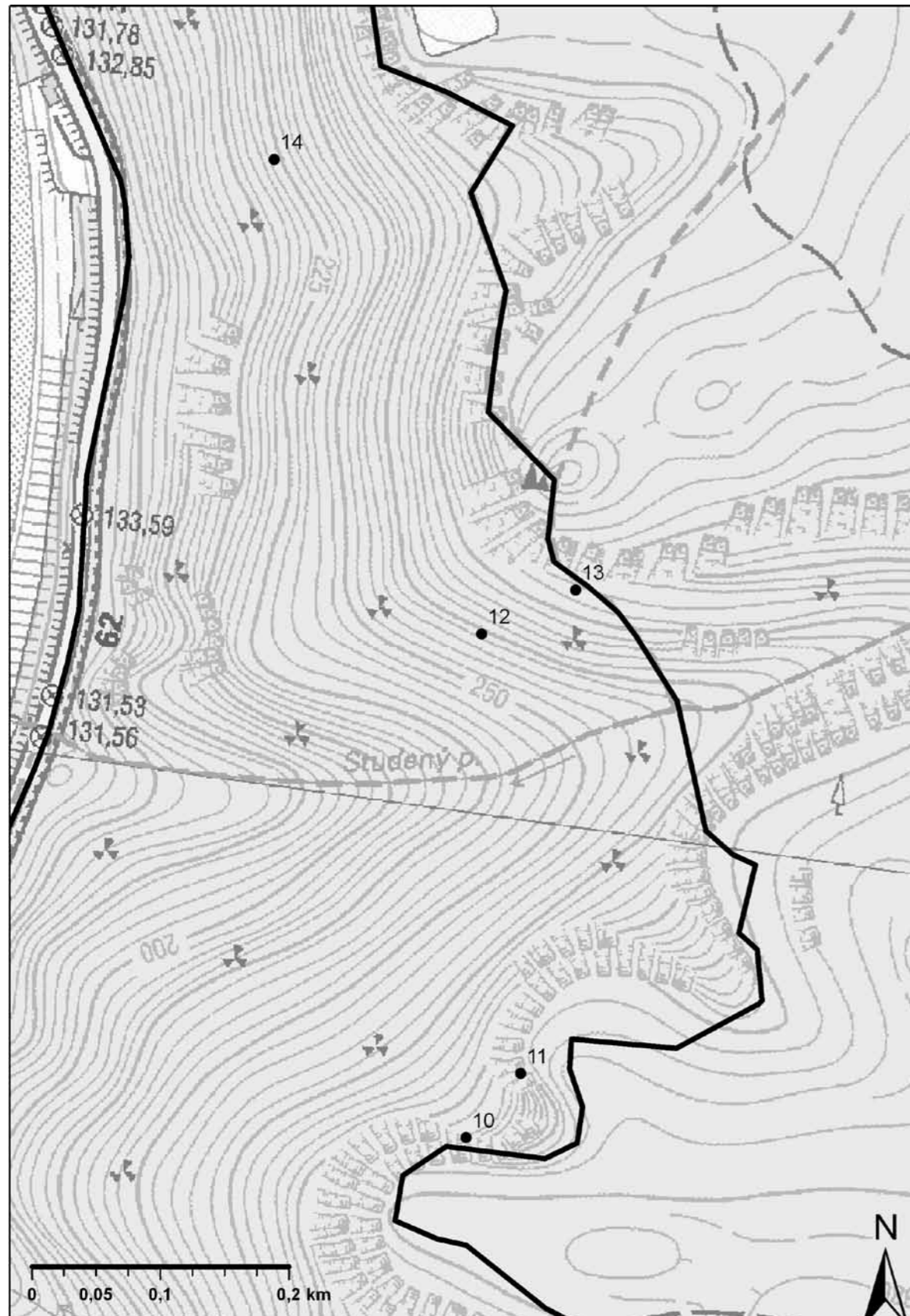
Obr. 3: Jeskyně ve střední části NPR Kaňon Labe, ležící v okolí Suchého potoka. Čísla zákresů odpovídají výše uvedenému komentovanému seznamu