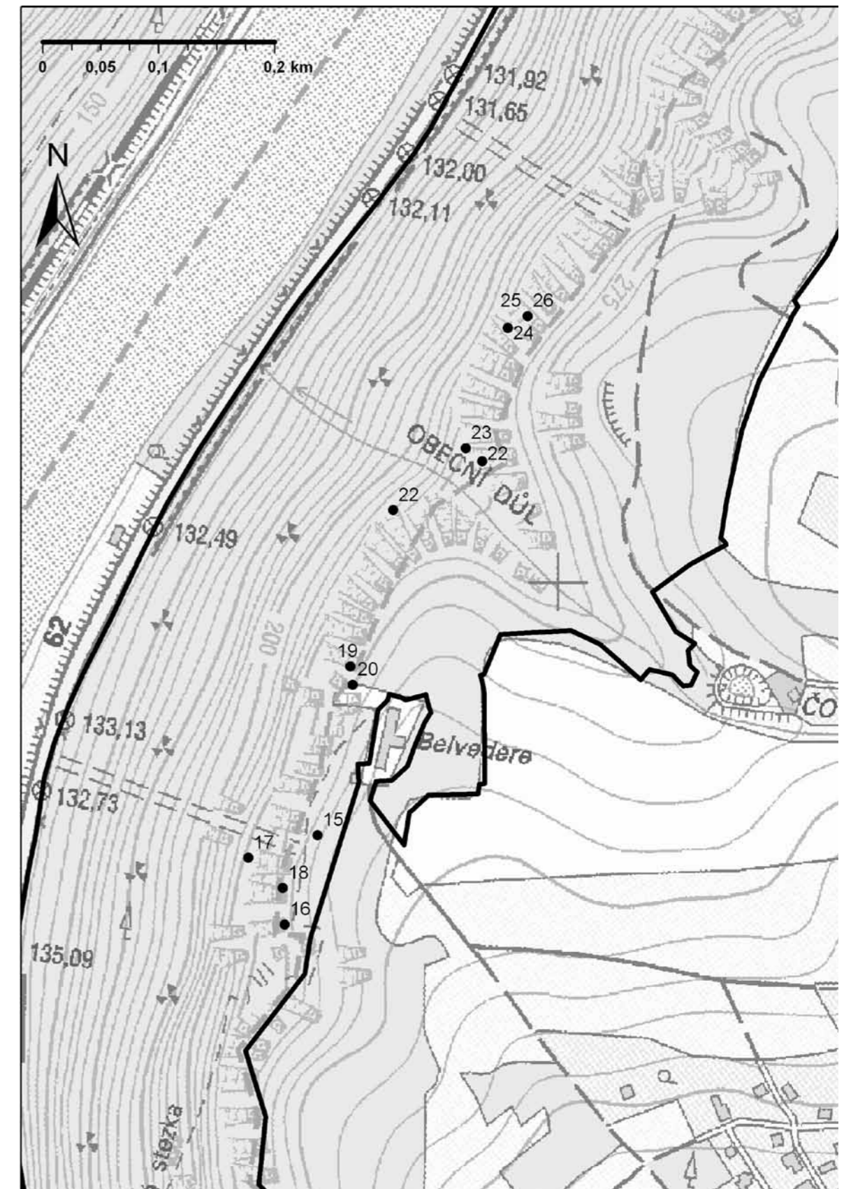
Obr. 2: Jeskyně v severní části NPR Kaňon Labe, ležící v blízkosti hotelu Belveder. Čísla zákresů odpovídají výše uvedenému komentovanému seznamu