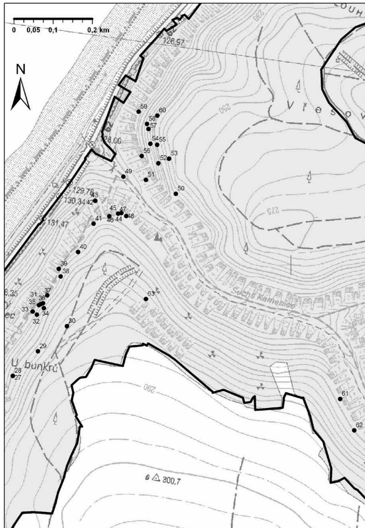
Obr. 1: Jeskyně v severní části NPR Kaňon Labe, ležící v okolí údolí Suché Kamenice. Čísla zákresů odpovídají výše uvedenému komentovanému seznamu